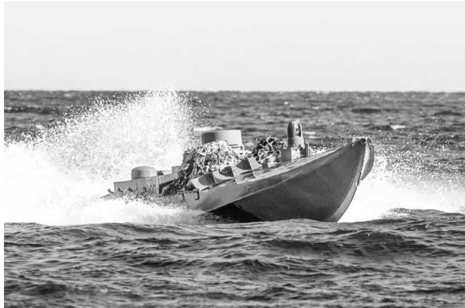
SEA BABY – український морський дрон, який змінив правила війни на Чорному морі.

«Я особисто схвалив направлення туди додаткового персоналу, щоб вивчати це поле бою дронів – як у наступальних, так і в оборонних аспектах, – аби ми засвоїли всі можливі уроки цього конфлікту й у режимі