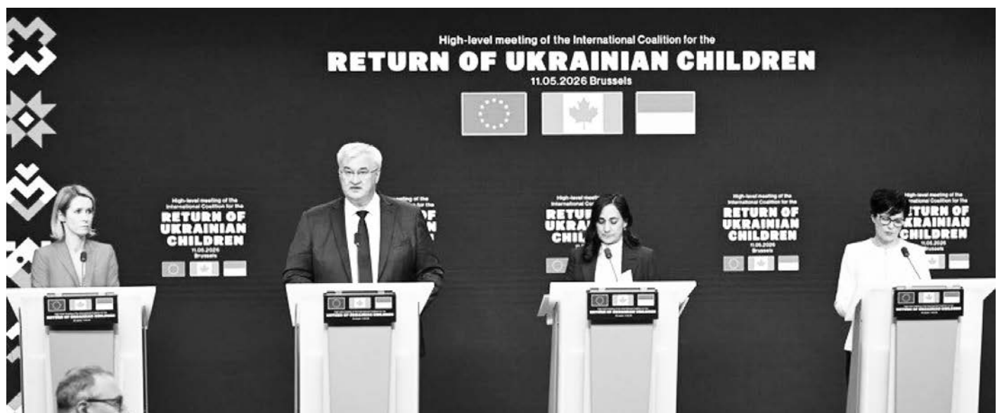
Кая Каллас, Андрій Сибіга, Аніта Ананд та Марта Кос.

Міжнародна коаліція продовжує рости. Під час засідання було офіційно оголошено про приєднання до її складу Швейцарії, Кіпру, Панами