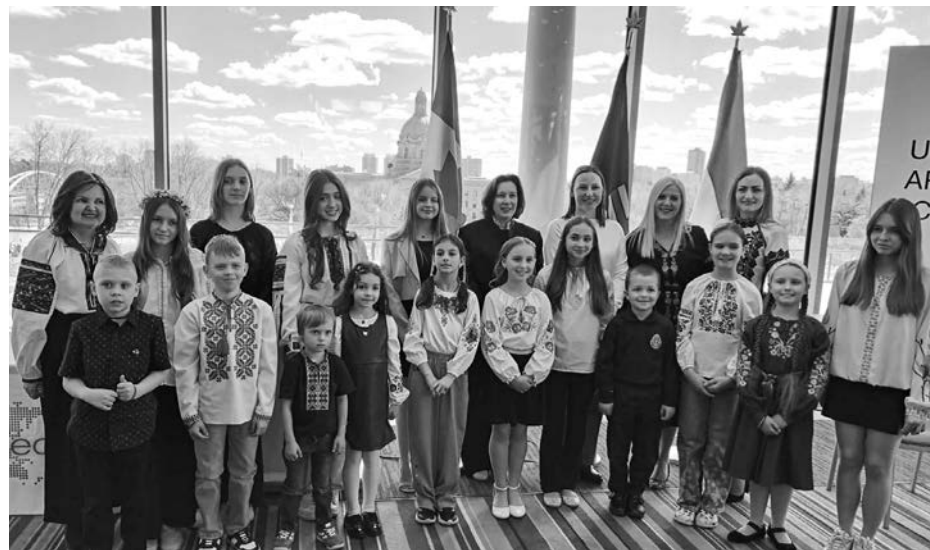
Талановиті учасники конкурсу.