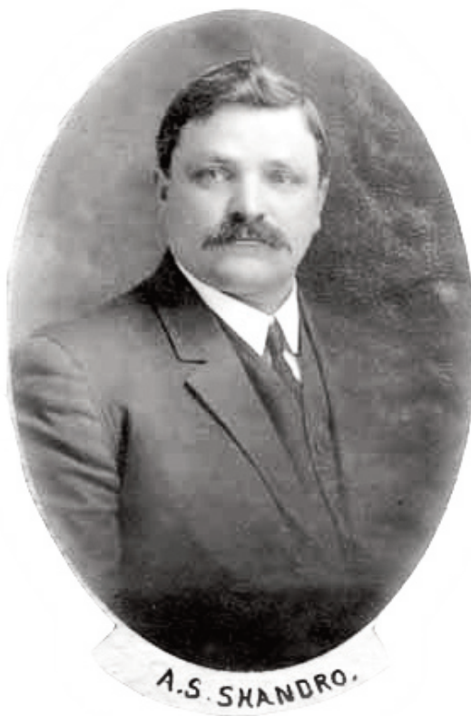
Андрій Шандро.

На відміну від багатьох переселенців, які присвячували себе фермерству, молодий Андрій обрав інший шлях. Він здобув освіту в Едмонтонському бізнес-коледжі та став федеральним інспектором земельних наділів. Ця посада дала йому не лише практичний досвід, а й розуміння державної системи, що стало основою для майбутньої політичної кар'єри.