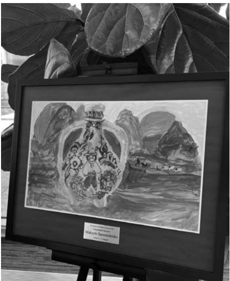
Малюнок Максима Самоседенка.