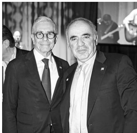
Роман Дубчак та Гаррі Каспаров у Торонто під час гала-вечора «Нагорода Тризуб» в Художній Галереї Онтаріо (AGO).

Багато хто сподівається на усунення Путіна, однак Каспаров стверджує, що його, найімовірніше, замінить інший представник так званих «силовиків» впливового кола осіб із силових структур, які фактично контролюють державу. Війна складається для Путіна невдало, тому серед еліт уже триває боротьба за владу, але це, на його думку, не завершить конфлікт. Інший експерт, колишній російський дипломат Борис Бондарев, який покинув Росію після початку повномасштабного вторгнення, вважає, що будь-який наступник Путіна