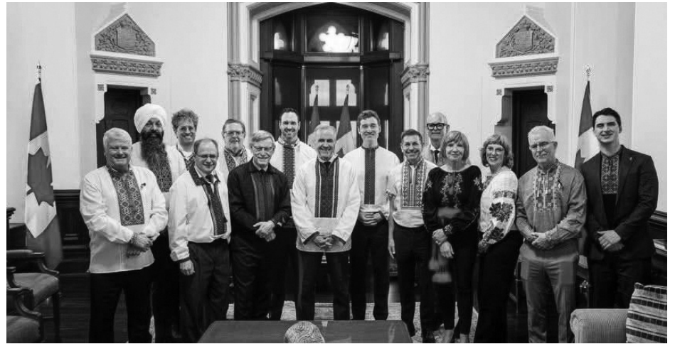
Під час відзначення Дня вишиванки на парламентському пагорбі прем'єр-міністру Марку Карні подарували його першу вишиванку.

Однією з найвідоміших подій є «Вишивана хода» — масштабний парад українців у вишиванках, який щороку збирає тисячі учасників. Колони людей із синьо-жовтими пра-