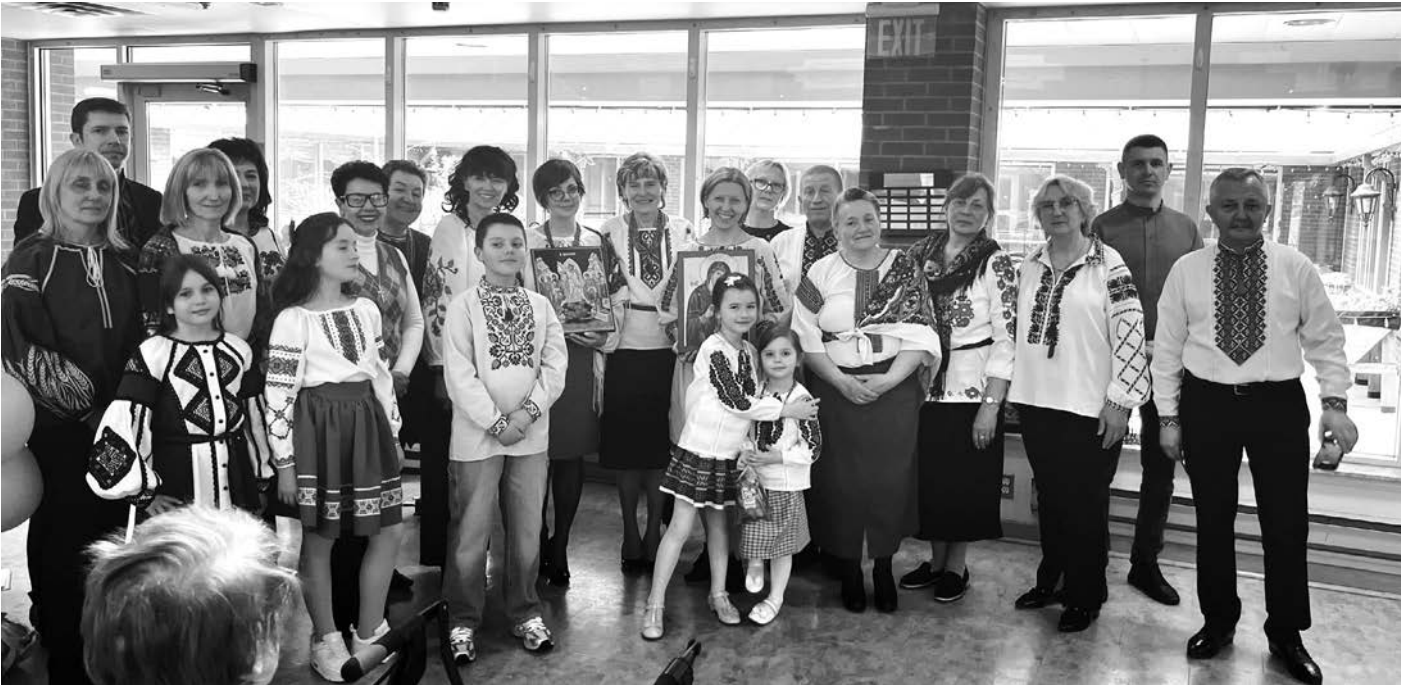
Учасники молитовної групи «Діти Святої Вервиці» при виконанні програми.

У неділю, 3 травня учасники молитовної групи «Діти Святої Вервиці», що діє при церкві Успіння Пресвятої Богородиці в Міссісазі завітали до Будинку з Серцем - Осередку Опіки (60 Richview Rd, Торонто).