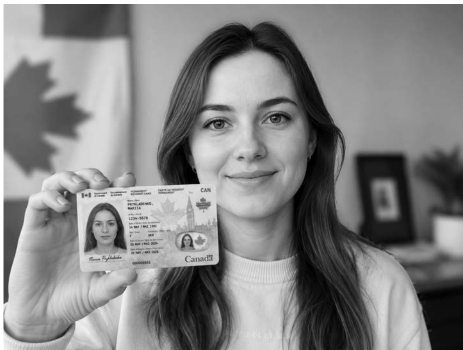
Ілюстративний зразок картки постійного резидента Канади.

Попри очікування, IRCC фактично підтвердило: нової програми немає. IRCC не відкриває нового набору заяв, не створює окремої категорії та не запроваджує нового шляху до дозволу на постійне проживання (permanent residence). Натомість йдеться лише про пріоритетний та пришвидшений розгляд певних заяв на постійне проживання, які вже знаходяться в системі, зокрема для працівників у невеликих містах та сільських громадах. Ключова фраза в повідомленні IRCC звучить дуже показово: “you do not need to take any action” («вам не потрібно вчиняти жодних дій»). Саме так зазвичай комунікують пришвидшення розгляду