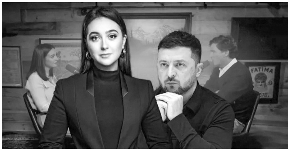
Скандальне інтерв'ю Юлії Мендель і Такера Карлсона.

У ширшому контексті неможливо ігнорувати і той факт, що риторика