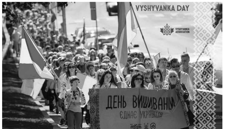
Хода в День Вишиванки до пам'ятника Лесі Українки в Гай Парку.

Її слова особливо актуально звучать у час, коли мільйони українців змушені жити далеко від дому. Для ба-