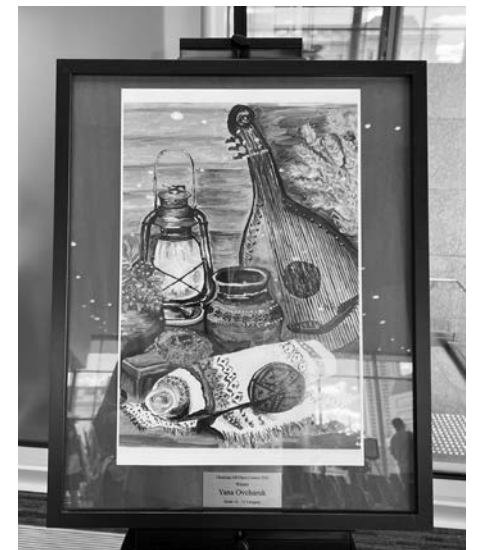
Картина Яни Овчарук.

В Едмонтоні відбулася урочиста церемонія відзначення учасників конкурсу Ukrainian ARTifacts Contest, який став справжнім святом української культури, творчості та молодих талантів Альберти. Захід об'єднав учнів українських двомовних та мовних програм провінції, які через мистецтво продемонстрували свою любов до української спадщини та культурних традицій.