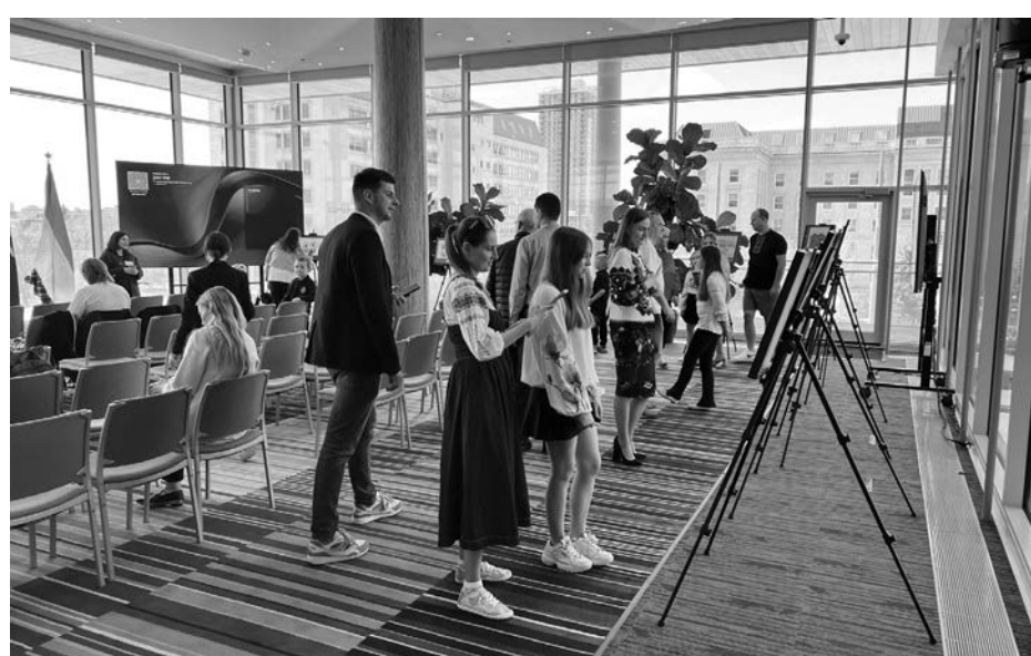
Розглядання майстерність юних митців.

гості заходу відзначили високий рівень творчості та майстерності юних митців. Роботи переможців були обрані за критеріями оригінальності, креативності, чіткості художнього