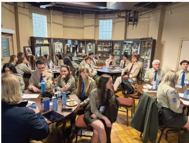
Пленарна сесія, п'ятниця 1 травня.