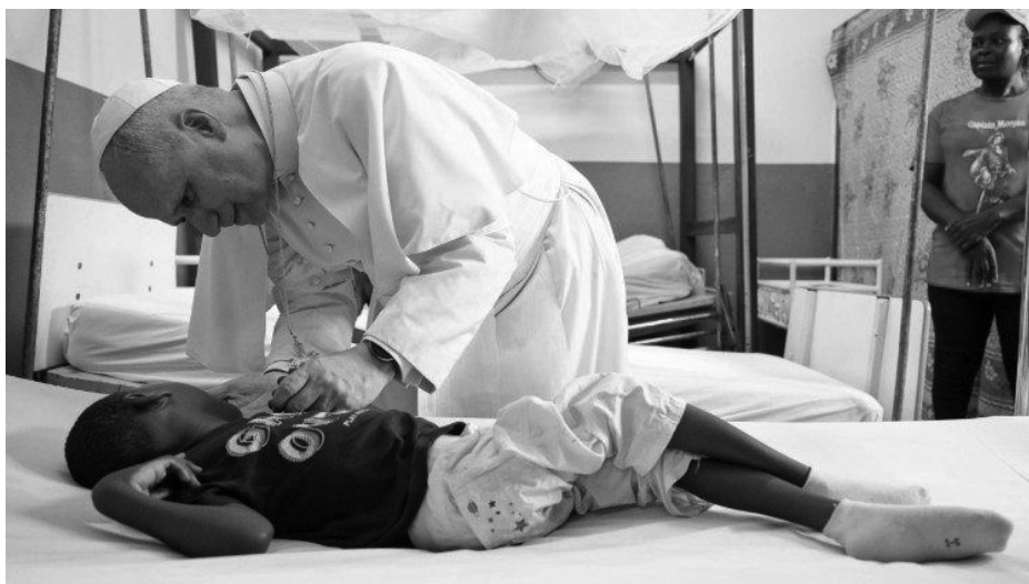
Папа Лев XIV відвідує та втішає пацієнта на лікарняному ліжку в католицькій лікарні Святого Павла в Дуалі, Камерун.

Протягом року Папа багато уваги приділяв молоді. Кульмінацією став Ювілей молоді в Римі, який зібрав