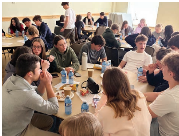
Учасники Провідницького семінару під час гутірки.