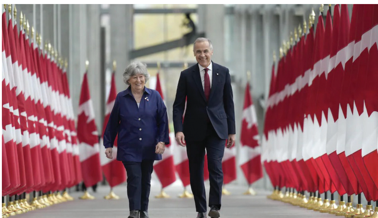
Прем'єр-міністр Марк Карні та Луїза Арбур у Національній галереї Канади.

Прем'єр-міністр Марк Карні офіційно оголосив про призначення Луїзи Арбур новою, 31-ю Генерал-губернаторкою Канади. Відповідне рішення було затверджене королем Чарльзом III за рекомендацією уряду Канади. Урочиста заява прозвучала 5 травня під час пресконференції у Національній галереї Канади. У своїй промові Карні назвав це призначення «утвердженням найкращих канадських традицій служіння, верховенства права та захисту людської гідності».