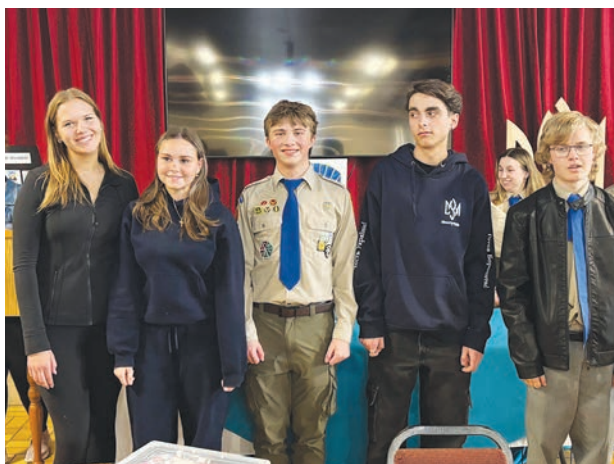
Випусники які завершили усі три модулі Провідницького семінару.