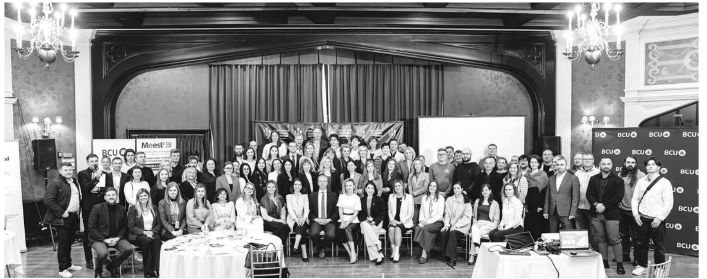
Учасники нової платформи українського економічного середовища.

Важливу роль у реалізації події відіграв титульний спонсор кредитова спілка BCU Financial. Участь BCU Financial стала не просто прикладом корпоративної підтримки громади, а свідченням стратегічного розуміння важливості розвитку українського підприємництва в Канаді. Протягом багатьох років BCU Financial залишається однією з ключових інституцій українсько-канадської громади, підтримуючи освітні, культурні, соціальні та бізнесові ініціативи. Саме