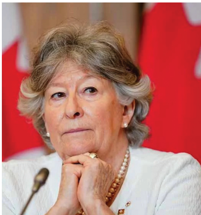
Луїза Арбур — наступна генерал-губернаторка Канади.