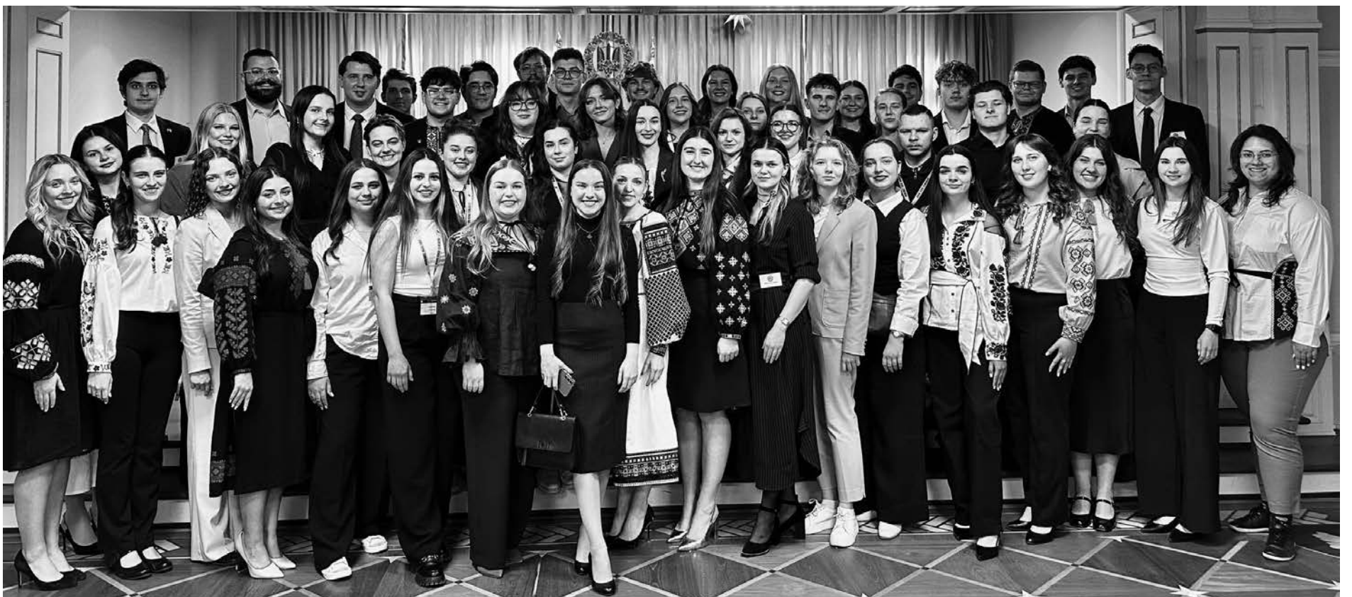
Учасники програми Молодіжних Амбасадорів КУК та представники Союзу Українських Студентів Канади.