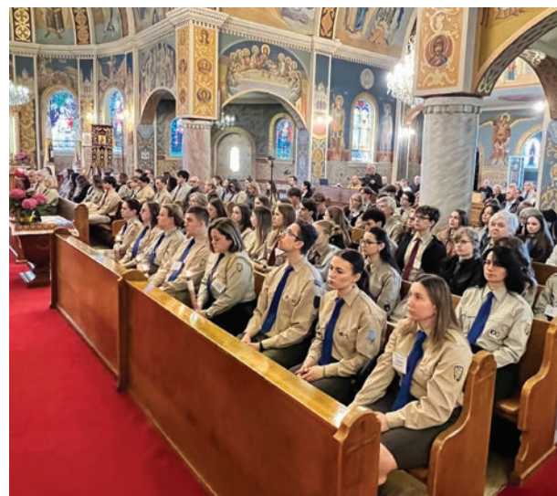
Учасники Пленуму на св. Літургії у церкві свв. Кирила і Методія.

Сесія «Комунікаційні правила і брендинг», яку