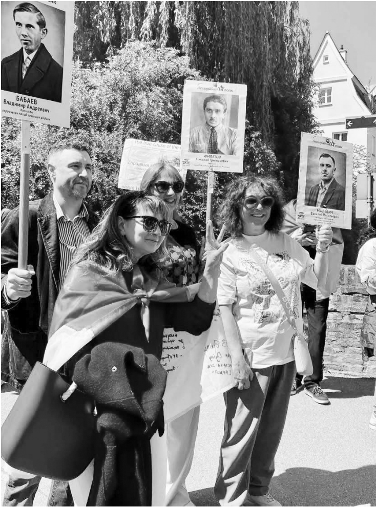
Активісти ходили маршем з портретом Бандери, Хвильового та Малука в Аугсбурзі, Німеччина.

Травень 2026 року. На Красній площі в Москві знову звучать марші, але гуркіт гусениць вже не чути. У той самий час на вулицях Києва, Варшави та Берліна панує зовсім інша атмосфера: там згадують загиблих у тиші. Те, що колись вважалося спільною сторінкою світової історії, сьогодні перетворилося на фронтową лінію ідеологічної війни. Паради в Росії та пам'ятні заходи в Європі більше не мають нічого спільного: це два різні світи, один з яких прагне реваншу, а інший воліє спокою.