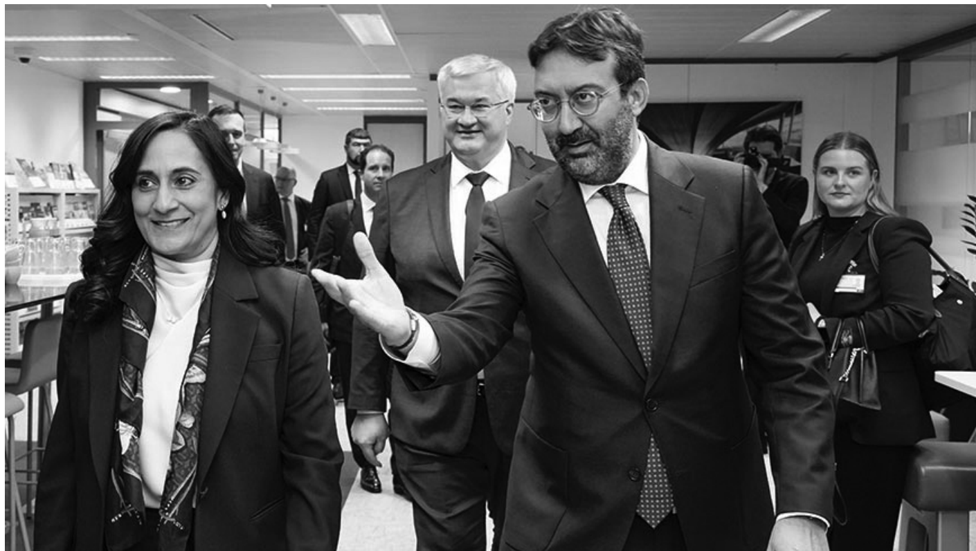
Ministers Anita Anand (left) and Andrii Sybiha (centre) are greeted by Council of Europe Director General of human rights and rule of law, Gianluca Esposito (right), for the signing ceremony.

Brussels, May 11, 2026 — Canada has reinforced its leadership role in international efforts to return Ukrainian children forcibly deported or displaced by Russia, as the Honourable Anita Anand, Minister of Foreign Affairs, concluded her participation in the High-level Meeting of the International Coalition for the Return of Ukrainian Children in Brussels.