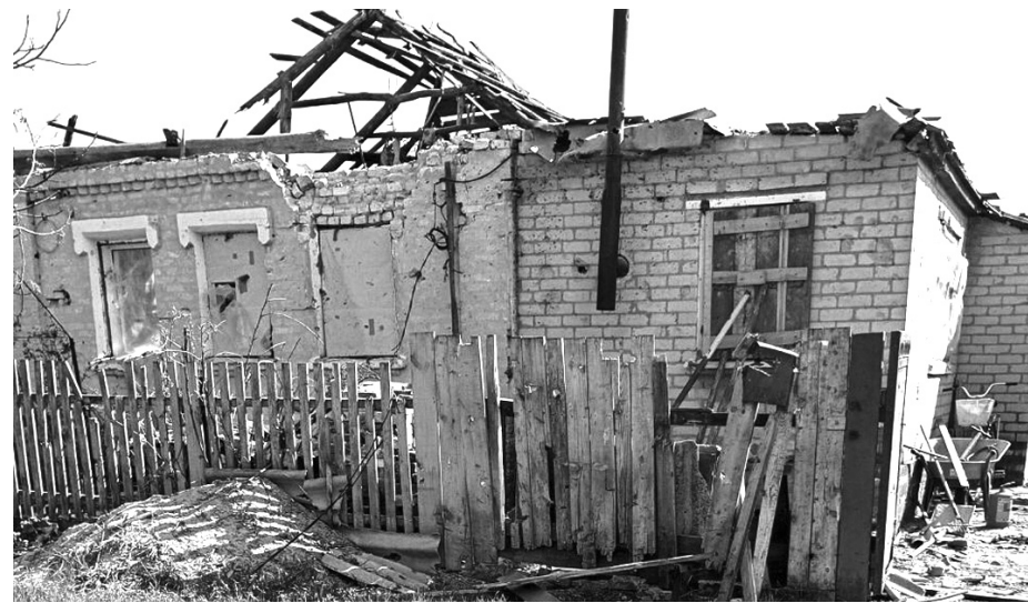
Наслідки російської атаки на Харківщині

мир'я» виявився умовним. Генеральний штаб ЗСУ та міжнародні спостерігачі повідомили, що бойові дії не припинялися повністю.