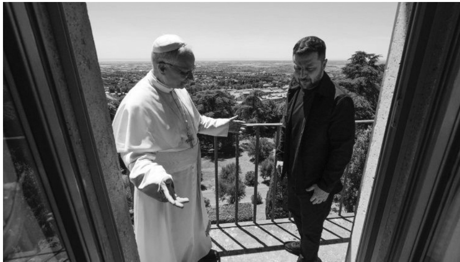
Папа Лев XIV і президент України Володимир Зеленський.

«Наша праця часто відбувається «за лаштунками», але вона спрямована на те, щоб переконати сторони скласти зброю та сісти за стіл переговорів».