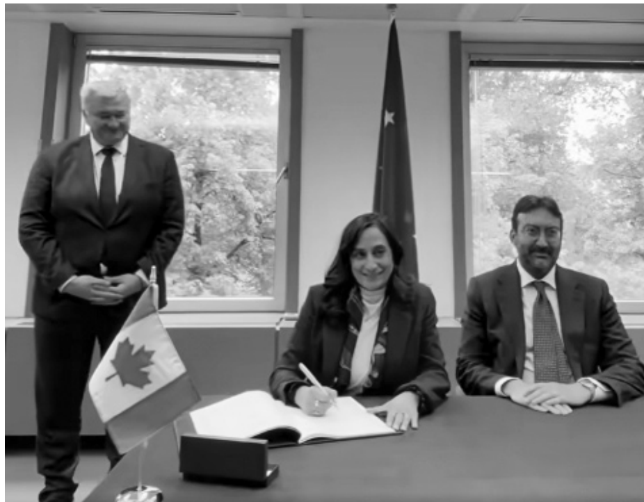
Minister Anita Anand signing landmark Coalition.

Canada's participation in both the Coalition and the emerging compensation mechanism underscores its ongoing role as a key international advocate for Ukraine's sovereignty, humanitarian recovery, and legal redress.