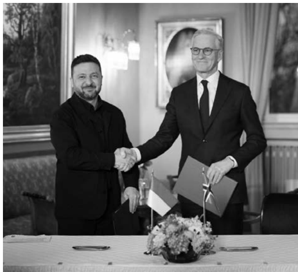
Володимир Зеленський та Йонас Гар Стєре

нести важчі боєприпаси, що робить їх ефективними проти бронетехніки, складів боєприпасів та систем протиповітряної оборони.