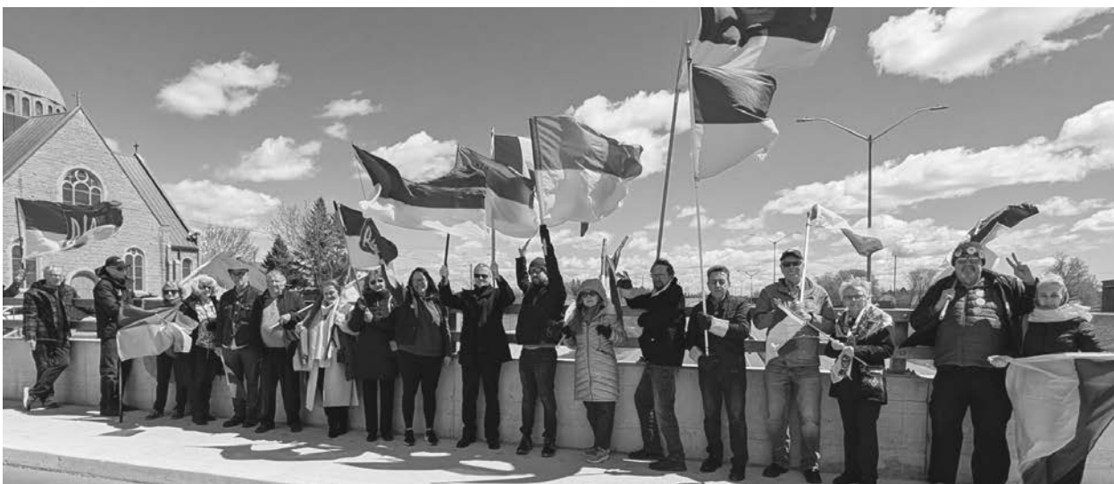
Учасники щотижневої акції.