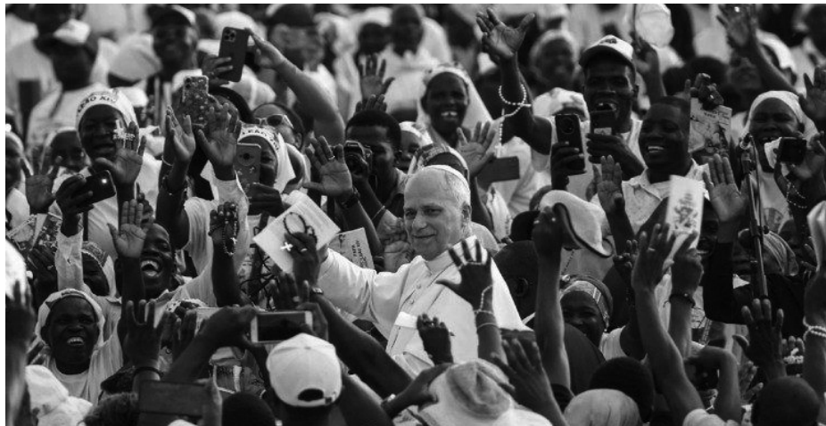
Натовп людей, які вітають Папу Лева XIV під час його історичної апостольської подорожі до Африки у квітні 2026 року.

У Лівані понтифік зустрічався з молоддю, релігійними лідерами та