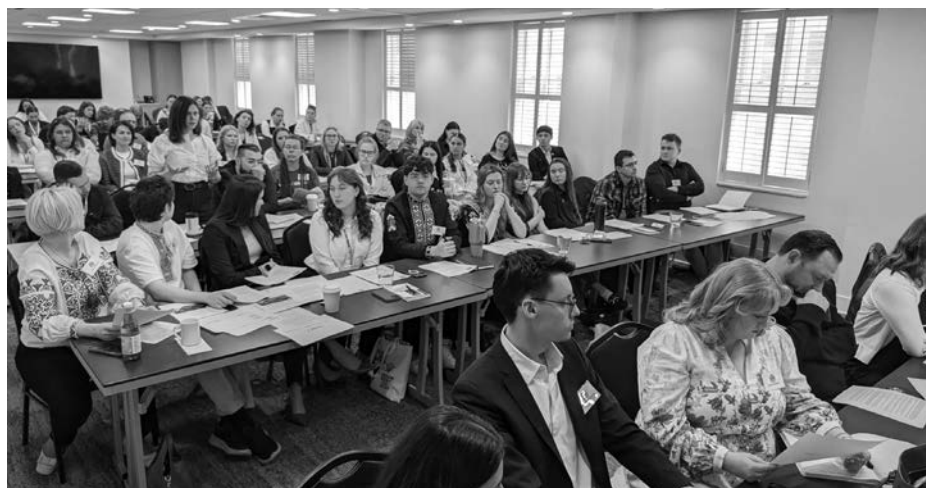
Активна участь українських студентів при круглих столах.

Вона також подякувала всім учасникам Дня адвокатури та парламента-