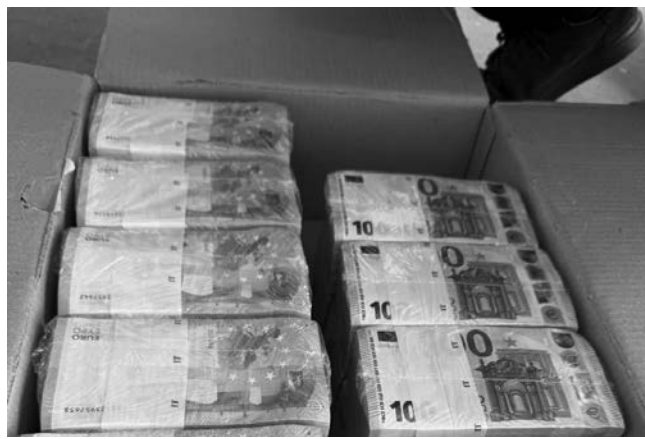
Вилучені Угорщиною цінності під час затримання інкасаторів "Ощадбанку".

За кілька тижнів, під тиском міжнародної спільноти, Будапешт пішов на перший крок і повернув Україні самі інкасаторські машини. Проте