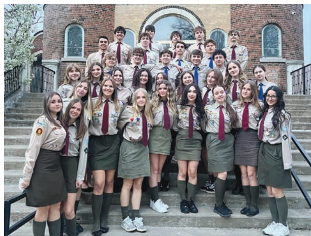
Учасники Провідницького семінару.