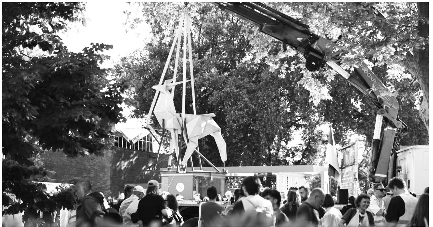
Сторінка Тетяни Бережної, віце-прем'єр-міністра з гуманітарної політики України, міністра культур.

Культурний російський десант, що приземлився у Венеції аж ніяк не назвати зі світу арту. Це справжні представники військово-силових структур росії. Зокрема, з-за маски сучасної арт-дилерки з лондонською освітою Анастасії Карнеєвої, визи-