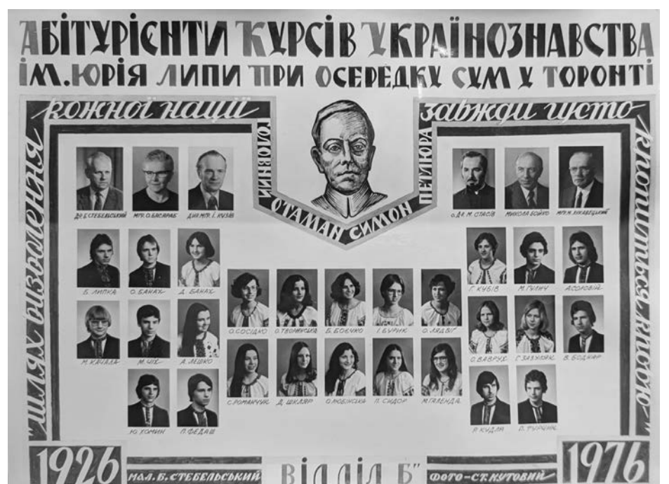
Матуральне табліо абітурієнтів українознавства (Б), Школа ім. Юрія Липи. Цитата Симона Петлюри: «Шлях визволення кожної нації завжди густо кропиться кров'ю.»