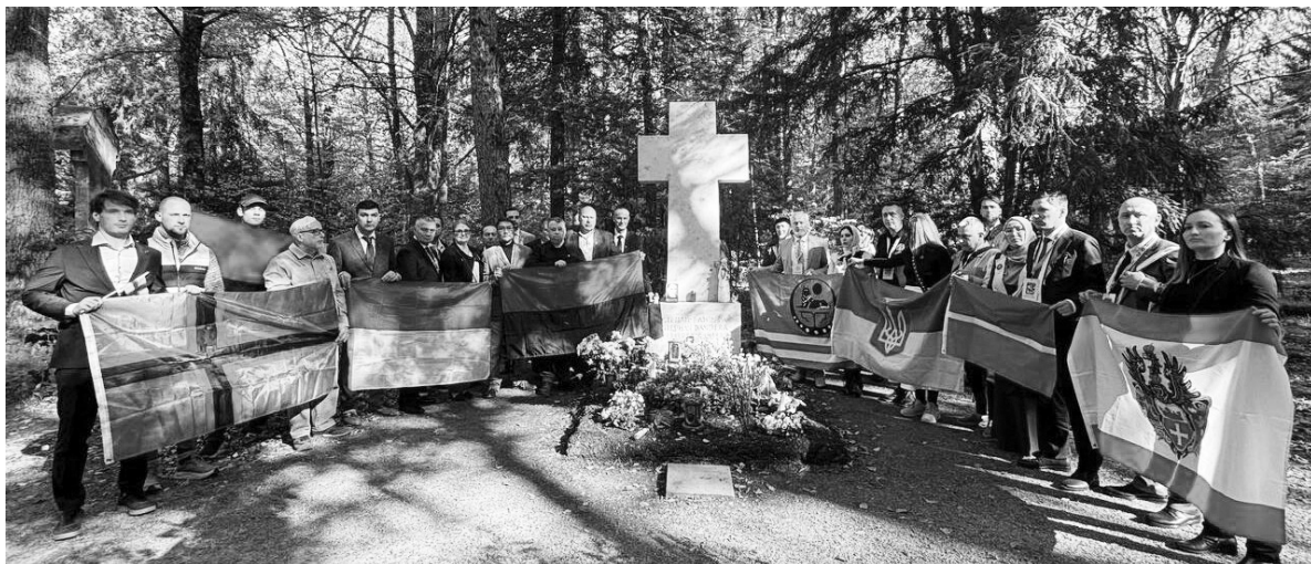
Учасники Конгресу віддали шану пам'яті провіднику ОУН Степану Бандері.