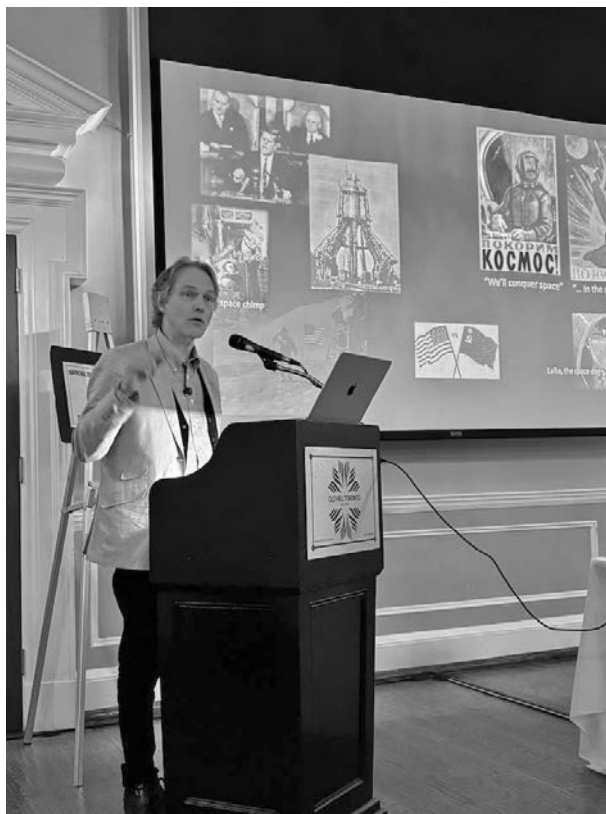
Професор Адріан Івахів.

Однак за цим прогресом приховувалися ризики. Аварії, екологічні катастрофи та приховування інформації стали темною стороною технічного розвитку.