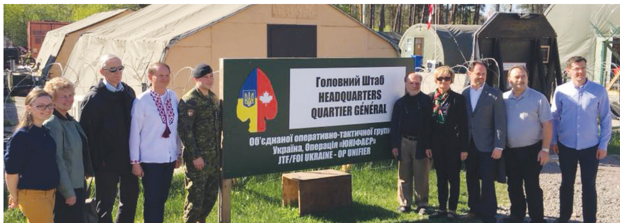
Візит до канадських військовослужбовців місії Operation UNIFIER та українських військових у Старичах, квітень 2018 року.

28 квітня уряд Канади на чолі з прем'єр-міністром Марком Карні представив новий економічний звіт 2026 року під гаслом «Канада сильна для всіх» («Canada Strong for All»). Серед ключових міжнародних пріоритетів є подальша масштабна підтримка України у боротьбі проти російської агресії та зміцнення оборонного партнерства між двома державами.