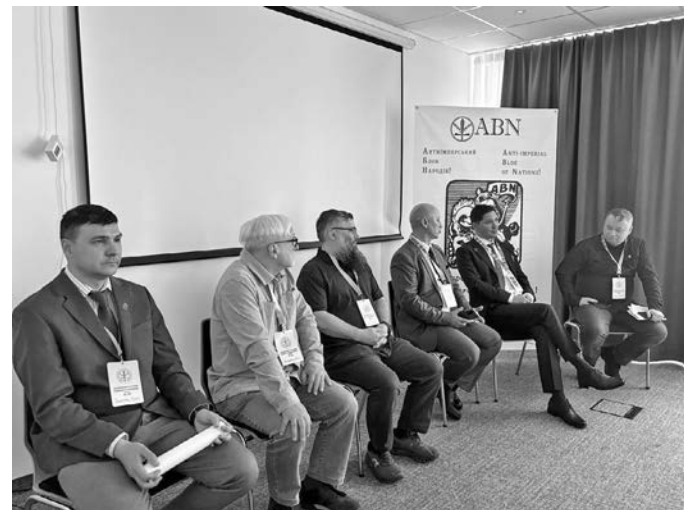
Делегати Другого ювілейного світового Конгресу АБН