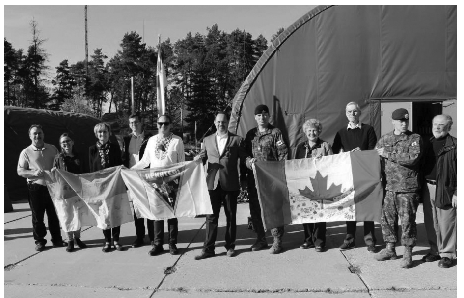
Представники українських державницьких організацій Канади під час візиту до Міжнародного центру миротворчості та безпеки у Старичах, квітень 2018 року.

Свою підтримку рішення уряду висловив і депутат федерального парламенту Іван Бейкер. Він зазначив, що пишається тим, що активно підтримував збільшення фінансування місії та радий бачити реалізацію цієї ініціативи в новому економічному оновленні. За словами де-