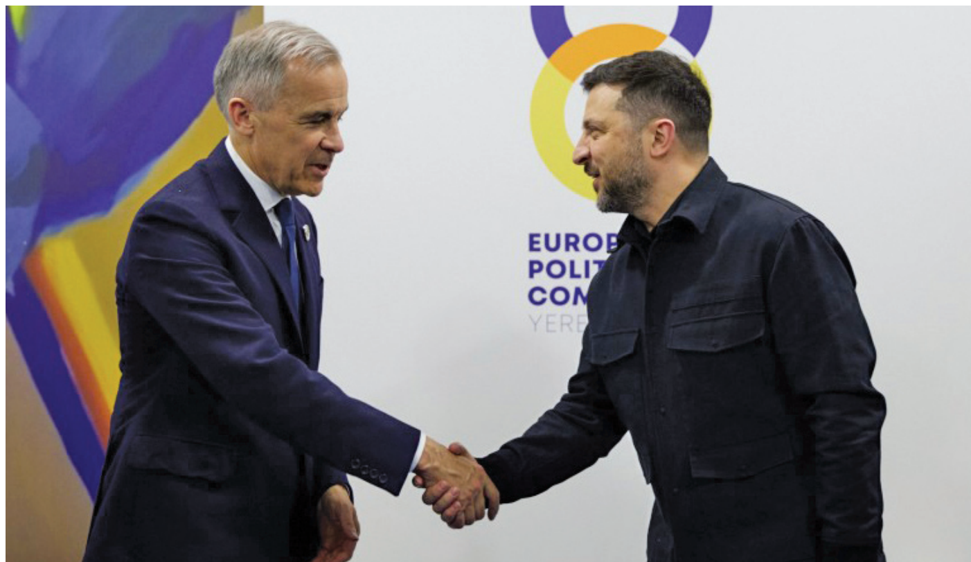
Прем'єр-міністр Канади Марк Карні і президент України Володимир Зеленський.

Канаді за постійну політичну й фінансову підтримку. «Я радий, що між нашими країнами та між нами особисто такі міцні відносини. Дякую за ваше рішення посилити нас. Ми маємо спонукати Путіна до миру, до дипломатії. Ми вдячні канадським друзям і всьому народові за таку сильну підтримку», - заявив Зеленський.