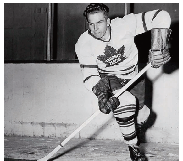
Білл Барілко.

Ця історія стала частиною канадської культурної пам'яті — зокрема