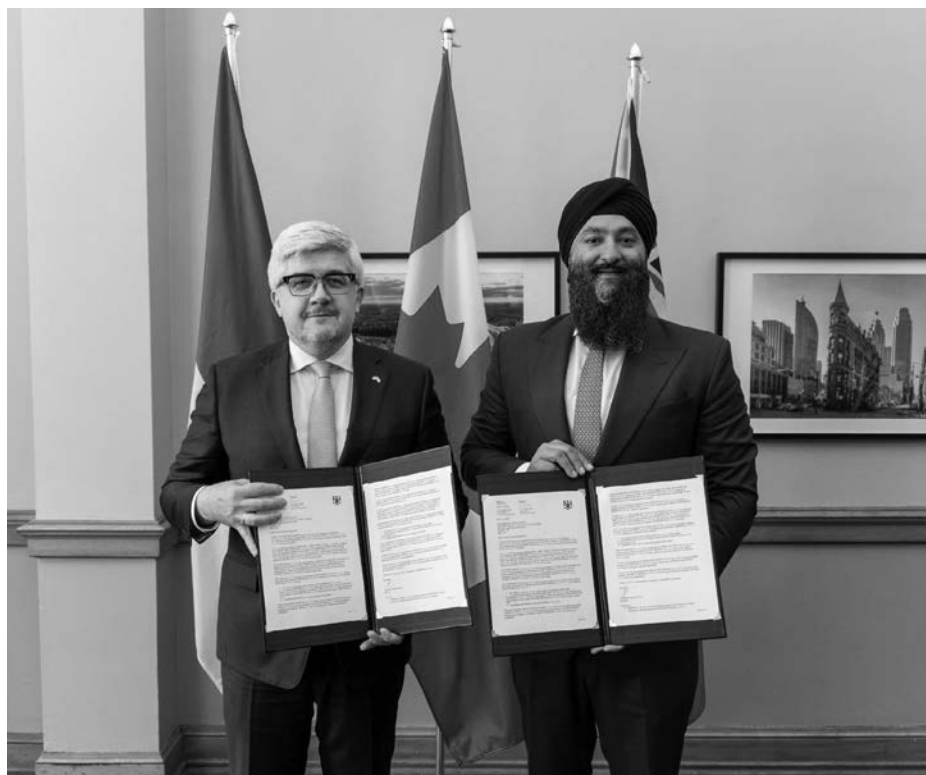
Андрій Плахотнюк, Надзвичайний і Повноважний Посол України в Канаді, та почесний Прабміт Сінгх Саркарія, Міністр транспорту Онтаріо.

«Рішення Онтаріо визнавати українські водійські посвідчення є практичним та важливим кроком,