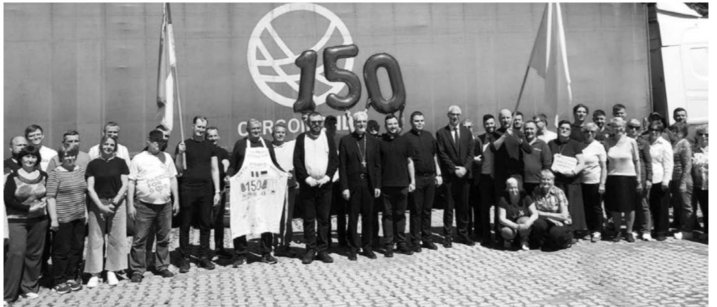
Від початку війни, 150-та автівка з гуманітарною допомогою, вирушила з св. Софії в Римі.

За словами представників Ватикану, причіп із медикаментами, продуктами харчування, засобами гігієни та одягом було відправлено до України 25 квітня з базилики Святої Софії Української Греко-Католицької Церкви в Римі. Цей вантаж став 150-ю автівкою з гуманітарною допомогою, що вирушила з базилики від початку війни.