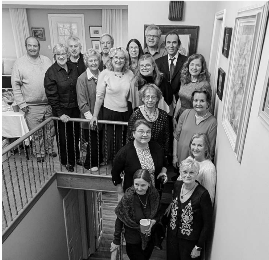
Святкування 60-літнього ювілею випуску. Зустріч матурантів Школи ім. Юрія Липи 24 квітня 2026 р.

Викладачі школи ім. Юрія Липи завжди приділяли велику увагу кожній деталі у справі збереження та передавання глибоко вкоріненої української історії й національної пам'яті. Переглядаючи світлини та