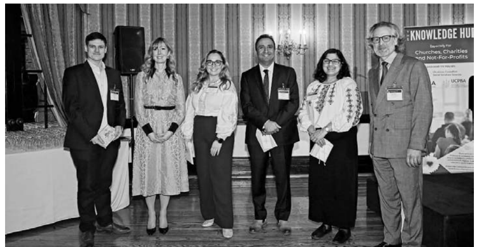
Учасники та доповідачі форуму «Knowledge Hub 2026».

Окрім технологічних питань, на форумі обговорювали ширші аспекти управління та дотримання нормативних вимог. Було відзначено, що благодійні та неприбуткові організації сьогодні працюють в умовах зростаючих регуляторних очікувань, часто маючи при цьому обмежені ресурси. Саме тому сектор особливо потребує практичних і доступних