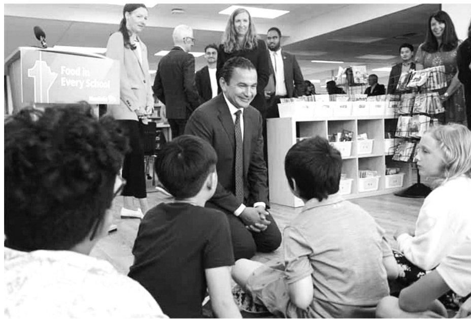
Прем'єр провінції Манітоба Ваб Кінью між школярами.

Попри заяви про можливі зміни, конкретні параметри ініціативи поки не оприлюднено. Зокрема, невідомо: