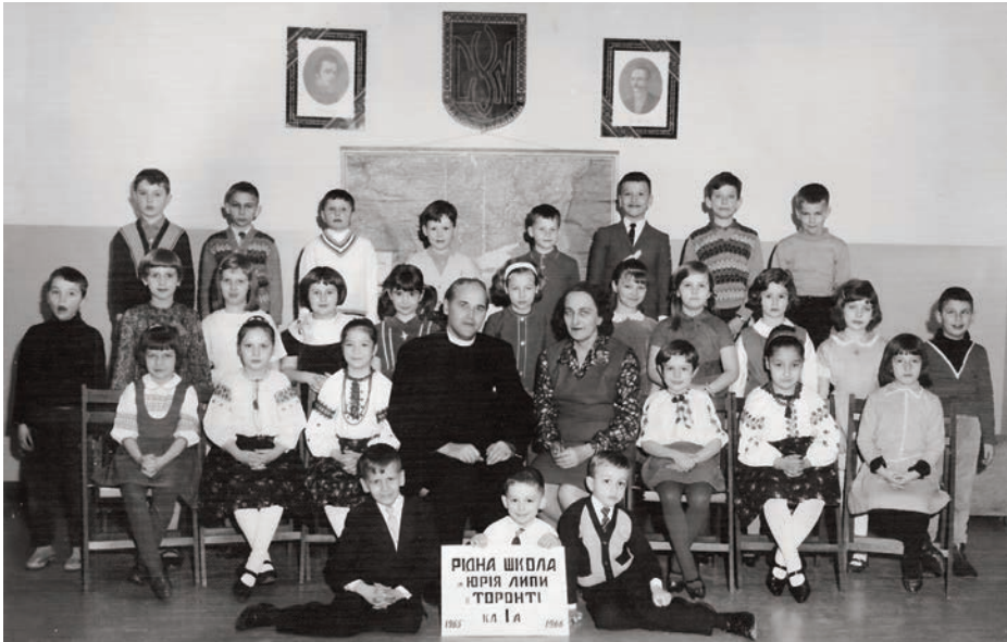
Рідна Школа ім. Юрія Липи, 1 клас (А), 1965–1966 навчальний рік.