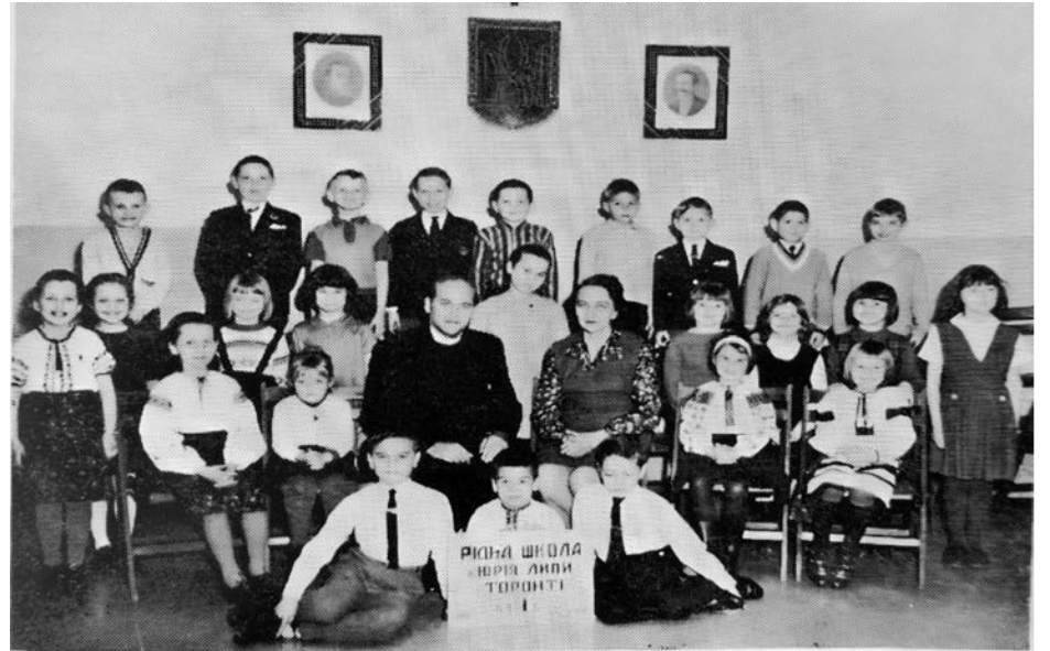
Рідна Школа ім. Юрія Липи, 1 клас (Б), 1965–1966 навчальний рік.