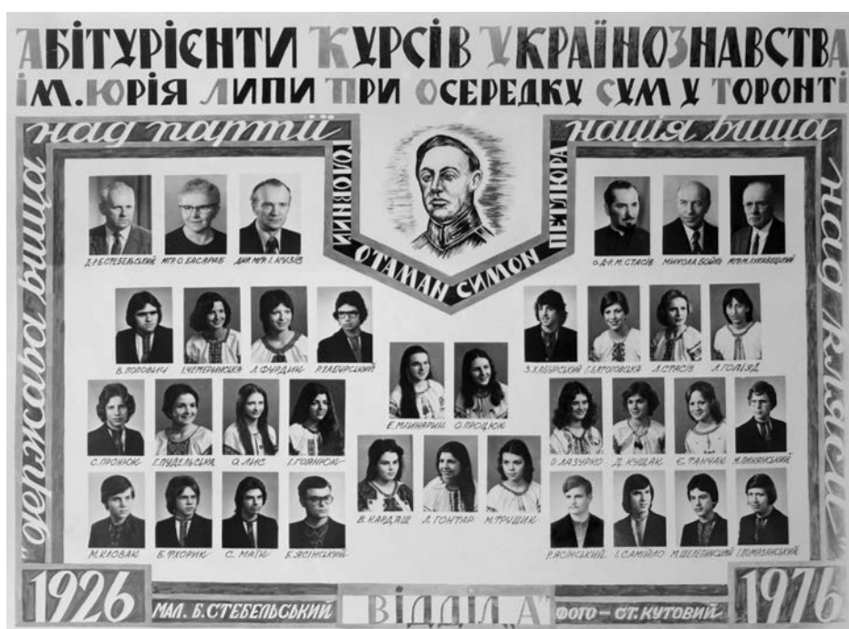
Матуральне табліо абітурієнтів українознавства (А), Школа ім. Юрія Липи. Цитата Симона Петлюри: «Держава вища над партію, нація вища над кляси.»