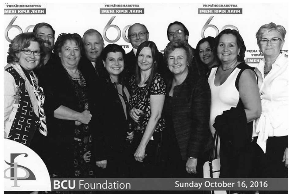
Зустріч матурантів з нагоди 50-літнього ювілею випуску (1976), в Олд Міл, 2016 р.

збиралися разом під час відзначення срібного ювілею на святкуванні 60 ліття школи імені Юрія Липи у 2016 році. Тепер же доля знову збрала їх, аби з пошаною й вдячністю згадати прожиті роки, людей і цінності, які назавжди сформували їх як українців.