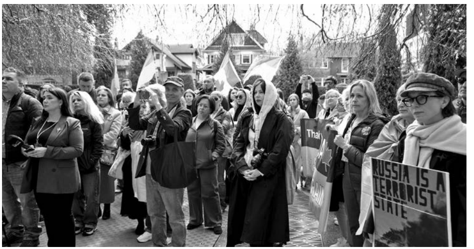
Представники української громади у Ванкувері зібралися біля будівлі міської ради, щоб підтримати ініціативу.

22 квітня 2026 року міська рада разом із постійним комітетом із фінансів та міських послуг міста Ванкувер розглянули і підтримали у принципі ініціативу щодо встановлення меморіалу жертвам Голодомору.