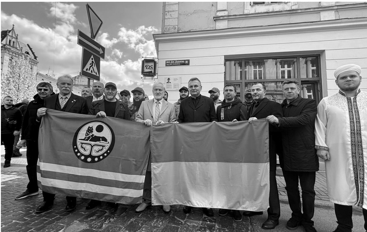
Відкриття меморіальної дошки Джохареві Дудаєву.

21 квітня у Львові, у 30-ту річницю від дня загибелі Президента Чеченської Республіки Ічкерія Джохара Дудаєва, відкрили меморіальну дошку на його честь.