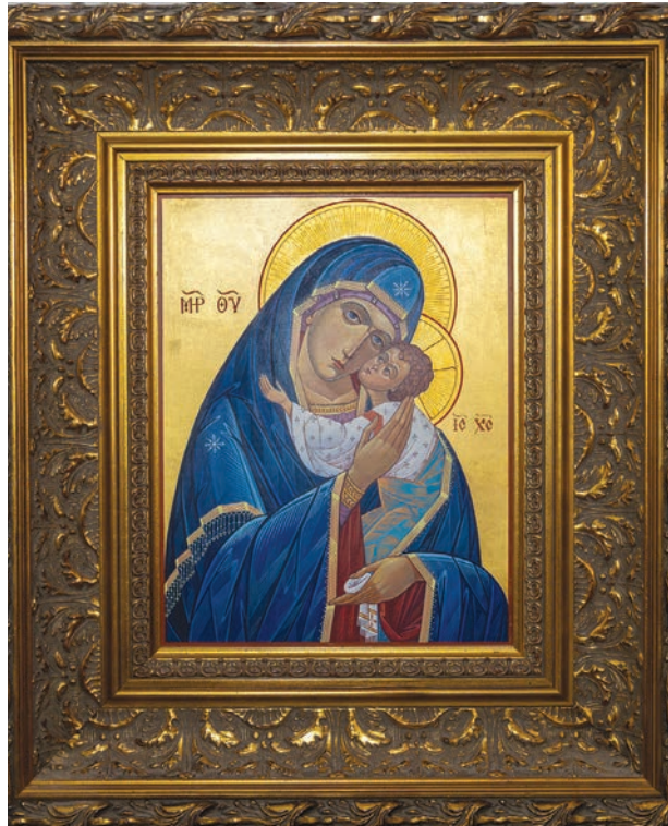
«Чорнобильська ікона Божої Матері», написана після катастрофи 26 квітня 1986 року.