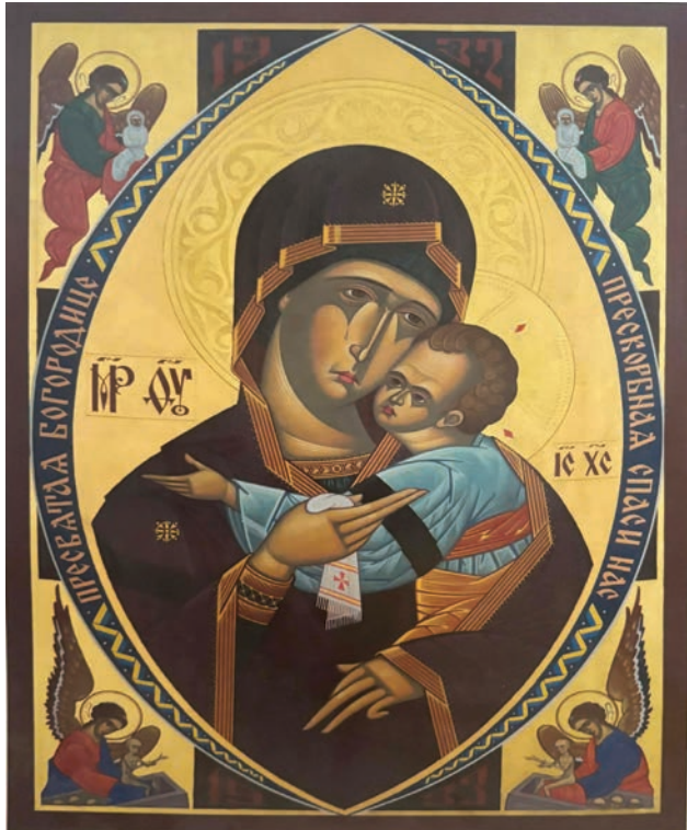
Ікона присвячена Голодомору.