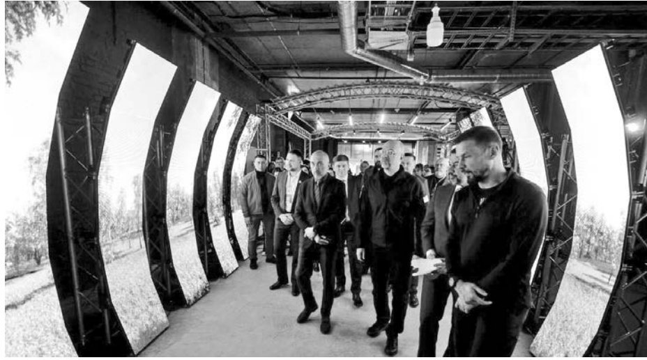
«Чорнобиль. 40 років потому. Історія, яка зобов'язує».