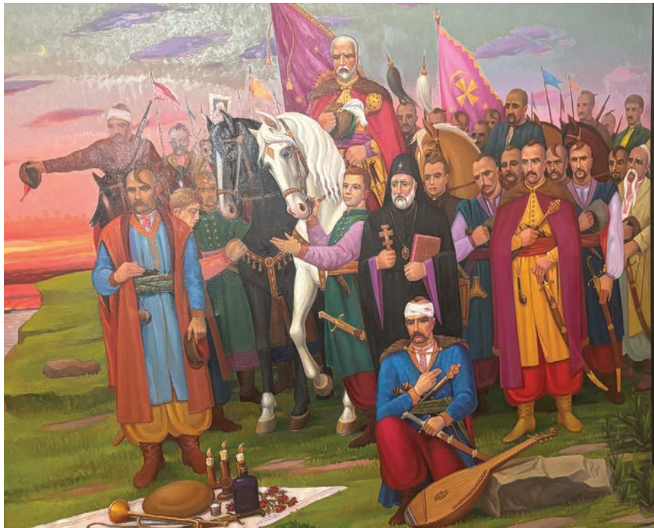
Масштабне полотно «Молитва за Україну Гетьмана Мазепи».