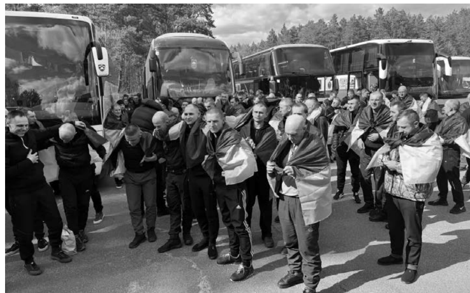
Звільнені військовослужбовці, які перетнули кордон.

Правозахисники наголошують на систематичному порушенні Женевських конвенцій: відсутність належної медичної допомоги, інформаційна ізоляція та психологічний тиск. Той факт, що серед звільнених є багато поранених та критично виснажених осіб, підтверджує: Росія продовжує використовувати полонених як інструмент тиску, ігноруючи міжнародне право.