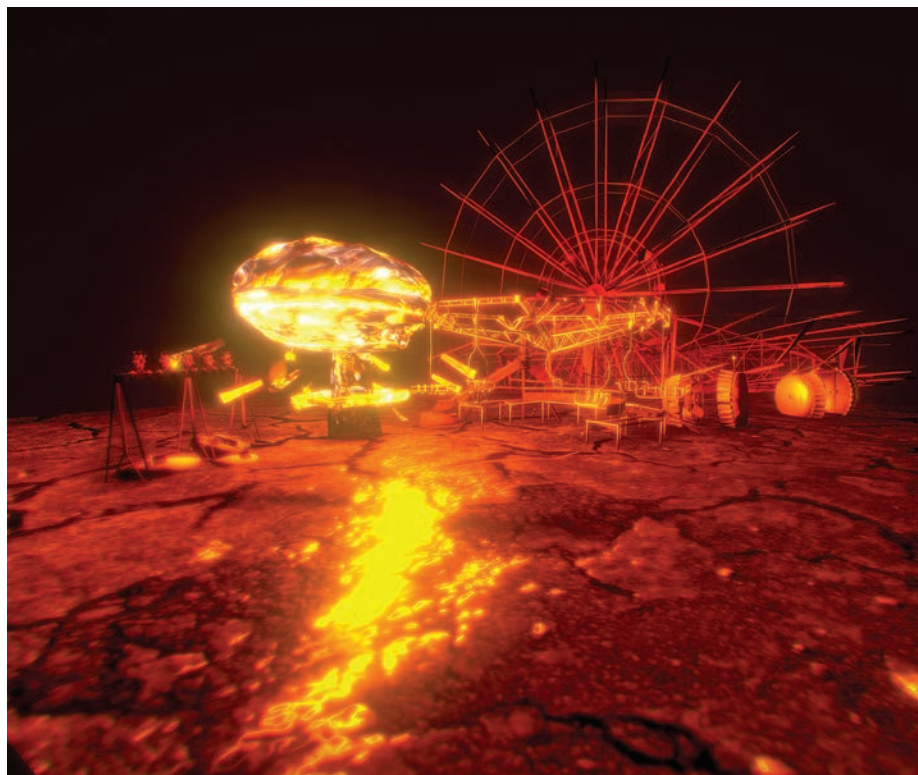
Експонат виставки Artefact Арсена Савадова.

лову скульптуру, а ЧАЕС — на майданчик для VR- та AR-експериментів. Це перша такого виду віртуальна виставка де беруть участь понад 70 митців, від 15-64 років.