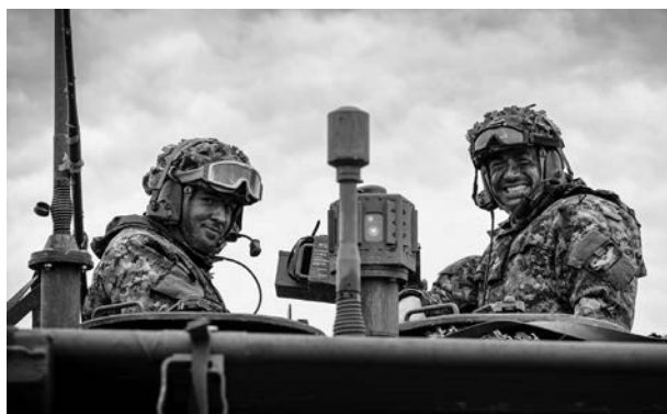
Канадські військовослужбовці з 1-го батальйону 22-го Королівського полку (Чарлі Компані), посміхаються на камеру під навчання "Кленова рішучість" (Maple Resolve) у місті Тетфорд-Мейнс, провінція Квебек, 13 квітня 2026 року.

Зміни торкнулися й умов вступу для іммігрантів: відтепер кандидати повинні або мати канадське громадянство, або прожити в країні щонайменше три роки у статусі постійного резидента, щоб бути повністю придатними до служби. Водночас