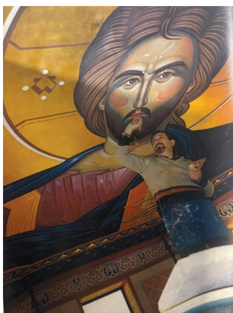
Розпис церкви святих Петра і Павла у Скарборо.

Картина «Повернись живим», прощання перед війною, де жінка прощається з коханим, проводжаючи його на війну. У роботі «Бугай і Хлопчик» маленький хлопчик у якого український прапор на сорочині стримує великого буйвола з літерою «Z» на чолі, потужний образ протистояння України агресору. Алегорія боротьби України, де ланцюг який тримає хлопець стає визначальним, адже