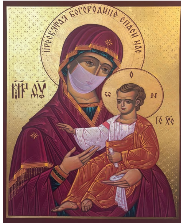
Ікона Богородиці, створена під час пандемії коронавірусу.