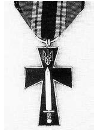
Хрест Симона Петлюри.