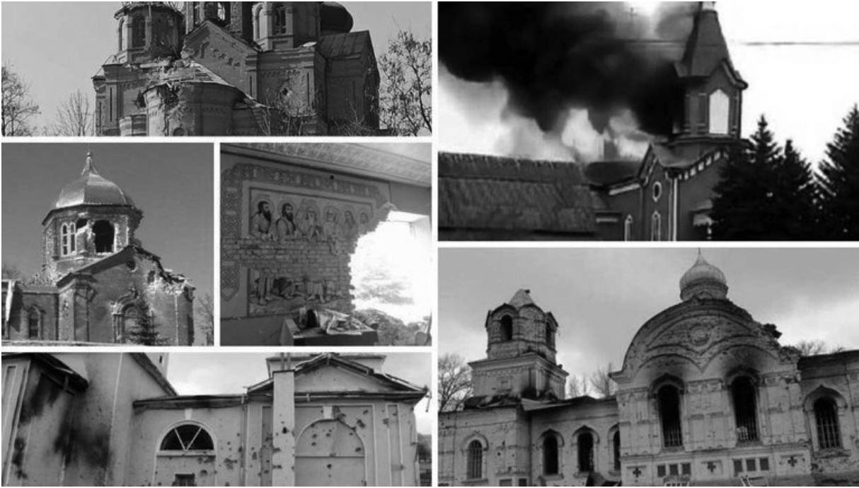
Атаковані об'єкти всесвітньої спадщини.