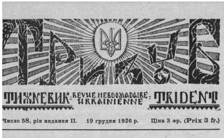
«Тризуб» Заснований з ініціативи Симона Петлюри.