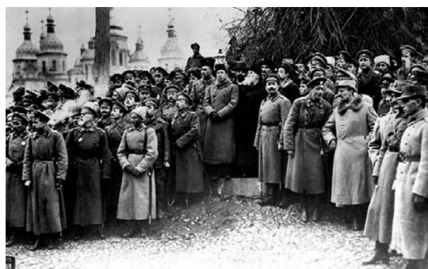
Маніфестація на Софійській площі в Києві з нагоди відкриття III Всеукраїнського військового з'їзду (в центрі — Симон Петлюра, Михайло Грушевський та Володимир Винниченко). Листопад 1917 року.

Петлюра був послідовним противником антиукраїнських режимів. Його протистояння з гетьманом Павлом Скоропадським призвело до арешту влітку 1918 року, але вже в листопаді він очолив