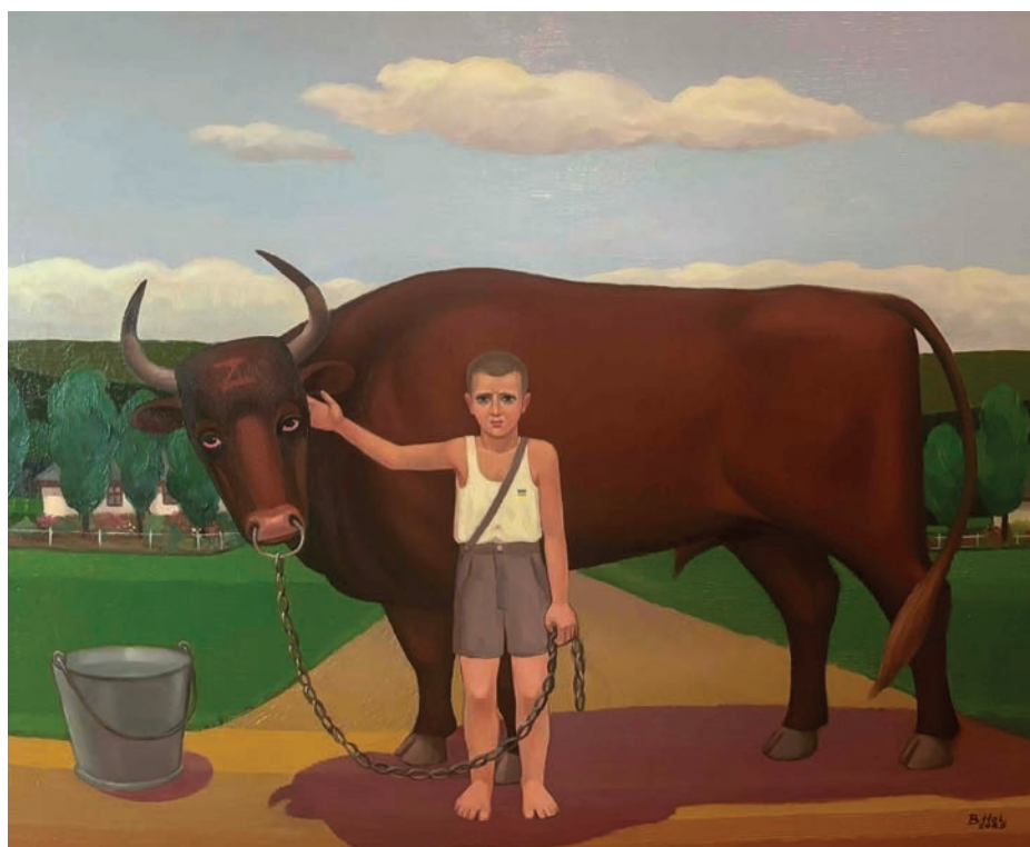
«Бугай і Хлопчик» алегорія боротьби України.