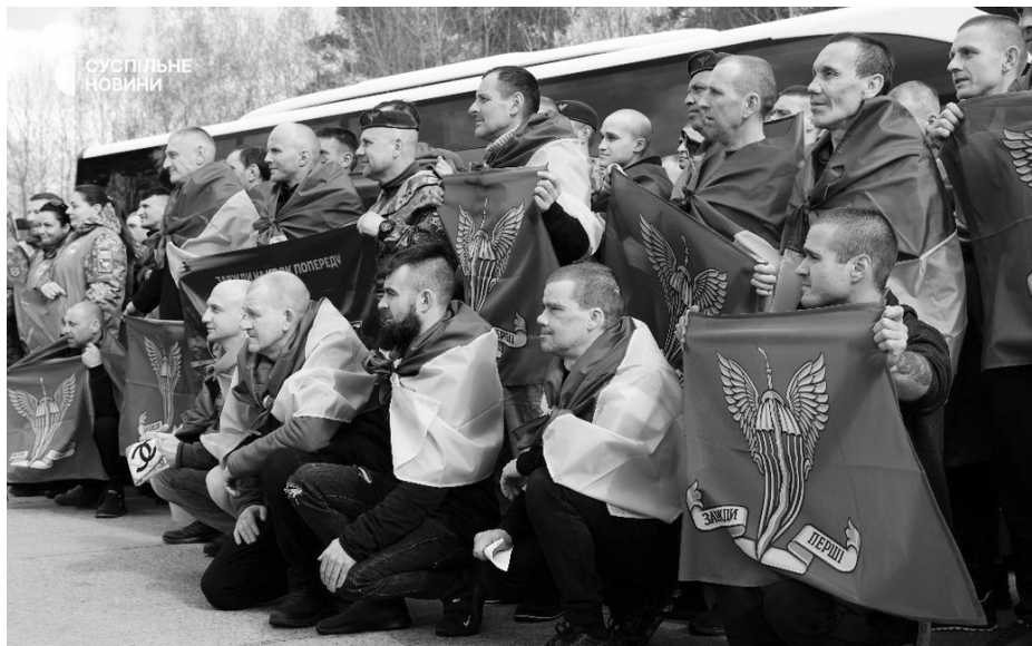
Українські військовослужбовці, звільнені з російського полону, Україна, 24 квітня 2026 року.

Ключовою особливістю цього обміну є те, що більшість повернутих захисників утримувалася на території Чеченської Республіки. Це викликає особливе занепокоєння правозахисників. Згідно зі свідченнями тих, хто вже пройшов первинне опитування, умови в чеченських СІЗО та неформальних тюрмах відрізняються особливою жорсткістю.