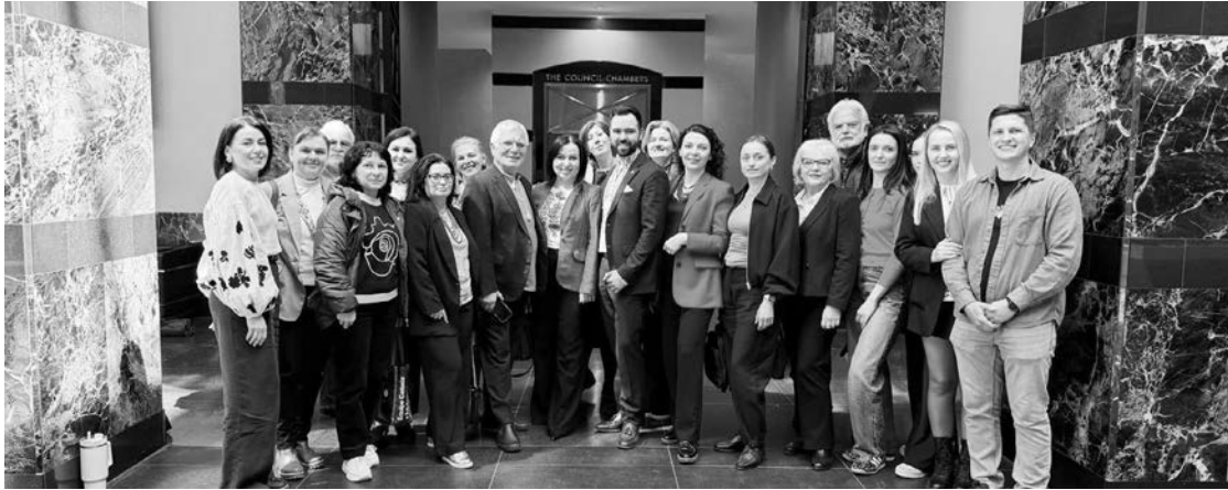
Представники української громади, які проживають у місті Міссісага, під час засідання міської ради, де розглядалося питання підтримки побратимства з Тернополем.