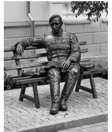
Пам'ятник С.Петлюри у Вінниці.

Симон Васильович Петлюра народився 10 (22) травня 1879 року в передмісті Полтави у багатодітній родині міщан козацького походження. Його батько займався дрібним візницьким промислом, а мати походила з роду Марченків. Початкову освіту майбутній державний діяч здобув у церковно-парафіяльній школі, а згодом вступив до Полтавської духовної семінарії.