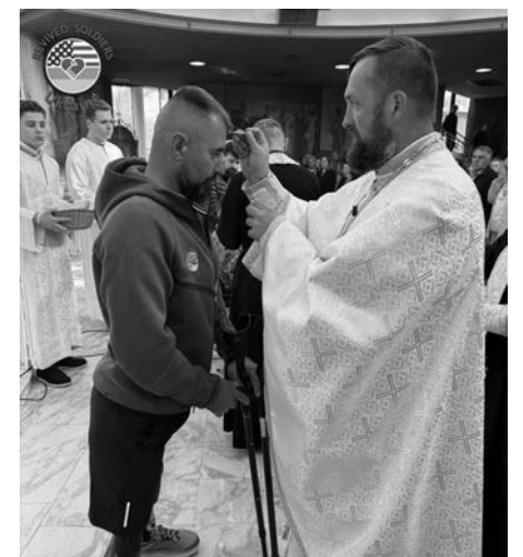
Українські захисники у храмі Святого Йосифа Обручника. Миряни зібрали 22,550 доларів США для фонду RSU.

Українська греко-католицька громада Чикаго провела масштабний благодійний збір на підтримку важкопоранених захисників. Під час недільних Богослужінь у храмі Святого Йосифа Обручника вдалося залучити 22 550 доларів США для фонду Revived Soldiers Ukraine (RSU).