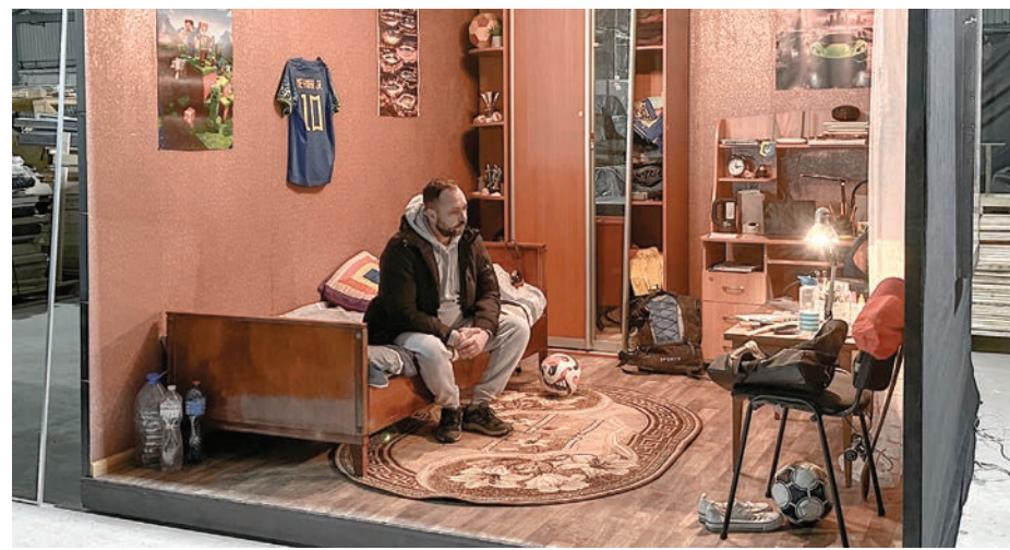
Повнорозмірна 1:1 репліка дитячої кімнати.