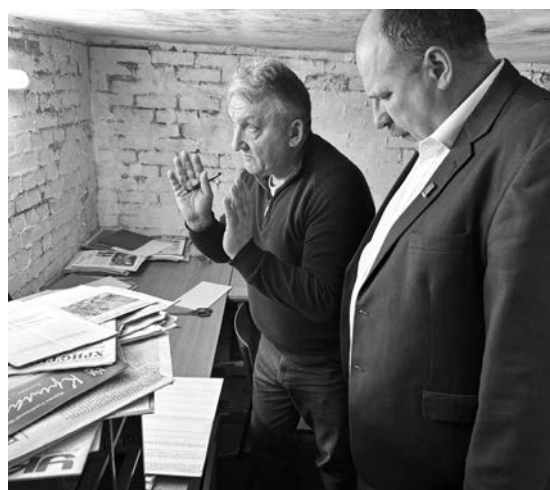
Збереження історичних матеріалів є відповідальністю усієї української громади.