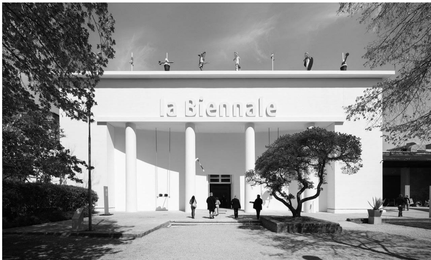
Будівля фестивалю.