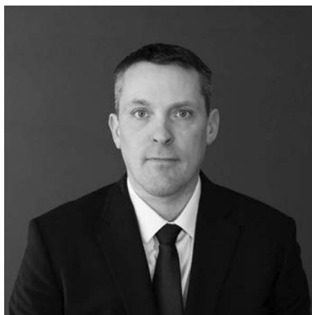
Нейт Горнер, Міністр фінансів Альберти і член Законодавчої асамблеї від округу Драмгеллер-Стеттлер (Drumheller–Stettler)

Прем'єр Даніель Сміт пропонує такі питання на референдумі на підставі того, що дохід від продажу нафти впав до 60 доларів США за бочку, і провінційний бюджет може