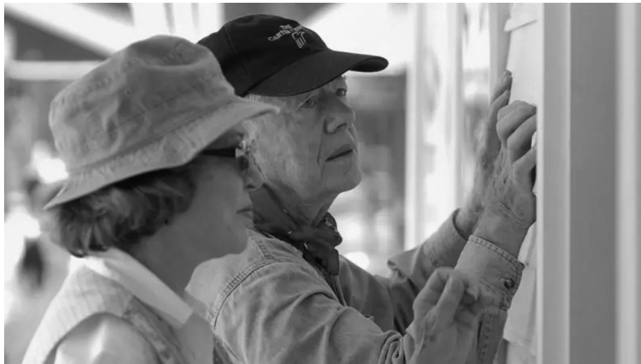
Джиммі Картер із дружиною Розаліндою допомагають волонтерам будувати житло в рамках благодійного проекту Habitat for Humanity.

Для стабілізації ситуації Канада залучила міжнародну допомогу. До складу американської групи фахівців, яка прибула на місце, входив 28-річний офіцер ВМС США Джиммі Картер. Робота в зоні ураження вимагала максимальної точності та жорсткого дотримання часу перебування через високий рівень радіації. За оцінками інженерів, безпечно перебування всередині реакторної зони не могло перевищувати 90 секунд.