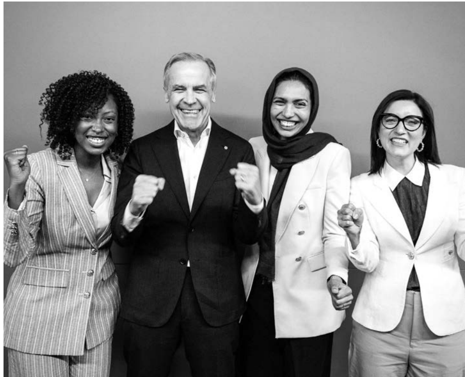
Тетяна Оґюст, Прем'єр-міністр Марк Карні, Долі Беґум та Даніель Мартін після перемоги на проміжних виборах.

Навіть відносно невелика перевага у кілька мандатів має суттєве значення для уряду. Більшість дозволяє