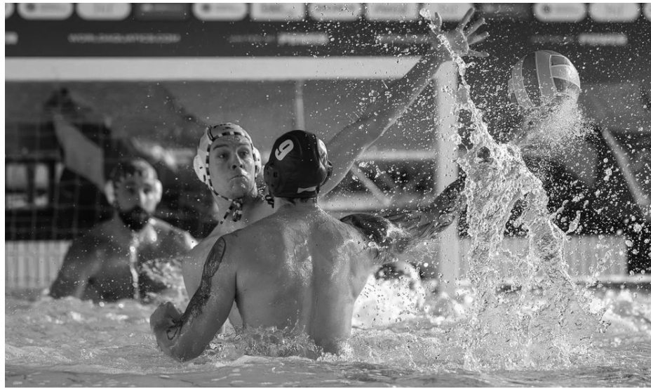
Матч збірної України з Францією на Кубку світу-2026. World Aquatics/Allezea Galea (Джерело-Суспільне Спорт).

Для Кремля кожен піднятий прапор на п'єдесталі World Aquatics це не спортивна перемога, а черговий доказ того, що світ «втомився» і готовий пробачити воєнні злочини заради ви-