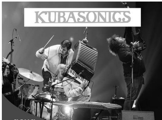
Виставку «Українська музика на преріях» відкриє унікальний гурт Kubasonics.