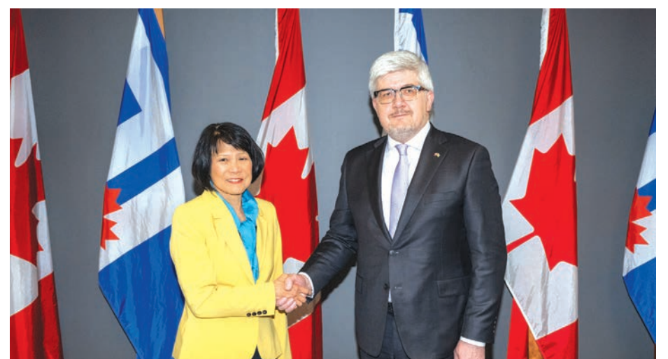
Мер міста Олівія Чау, посол України Андрій Плахотнюк. Зміцненні партнерства між містами-побратимами Торонто та Києвом.

13 квітня 2026 року в міській ратуші Торонто відбулася важлива дипломатична зустріч: мер міста Олівія Чау прийняла Надзвичайного і Повноважного Посла України в Канаді Андрія Плахотнюка та Генерального консула України в Торонто Олега Ніколенка. Цей візит став першим офіційним відвіданням послом Плахотнюком міської ратуші Торонто.