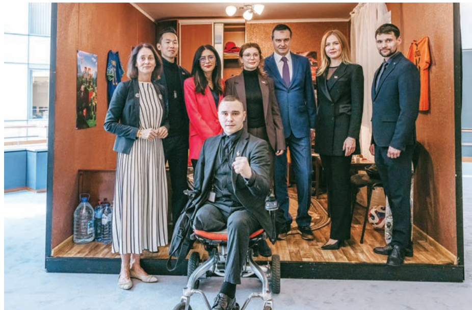
Інсталяція «Порожні ліжка» у стінах Європейського парламенту.

Інсталяцію створили Жанна Галеева та Ісаак Йонг, на основі оригінальної концепції Філа Бюхлера.