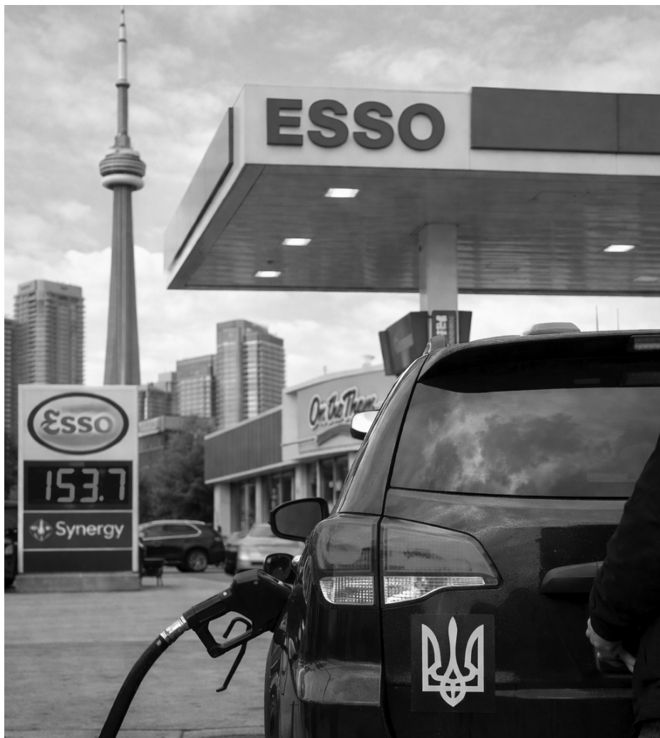
Першим важливим рішенням стало зниження цін на пальне. З 20 квітня до 7 вересня, 2026 зменшується федеральний акцизний податок на бензин. На заправках можна буде заощадити до 10 центів за літр бензину та 4 центи за літр дизельного пального.