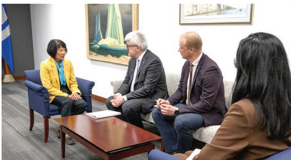
Мер міста Торонто Олівія Чау, Повноважний Посол України в Канаді Андрій Плахотнюк, Генеральний консула України в Торонто Олег Ніколенко.