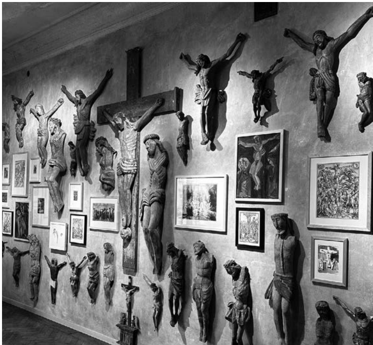
«Страсті Христові».

У самому серці Львова, в стінах артцентру Павла Гудімова «Я Галерея», розгорнулася одна із знакових мистецьких подій цієї весни. Виставка «Страсті», яка триватиме до 21 червня, це не просто збірка творів на релігійну тематику. Це глибоке, подекуди болюче, але вкрай необхідне дослідження людських страждань, віри та неминучої перемоги світла над темрявою, що звучить особливо гостро на тлі сучасної боротьби України за своє існування.