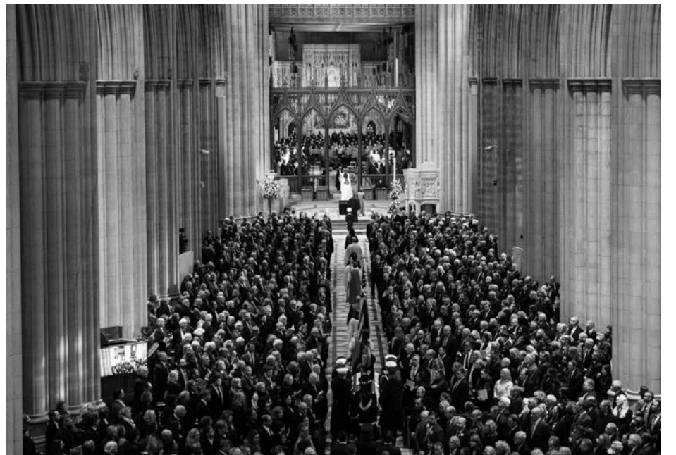
Церемонія прощання з Джиммі Картером в Національному соборі у Вашингтоні. 9 січня 2025 року.