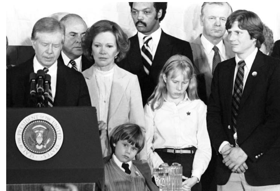
Картер вперше виходить до журналістів після поразки на виборах 1980-го року. Позаду нього — дружина Розалін і діти.