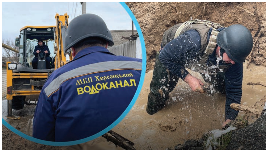
У Херсоні перебої з водопостачанням спричинені обстрілами російської армії, що значно ускладнюють роботу аварійно-ремонтних служб.

Про цю загрозу також попередив президент Володимир Зеленський, наголосивши, що водна інфраструктура може стати однією з наступних