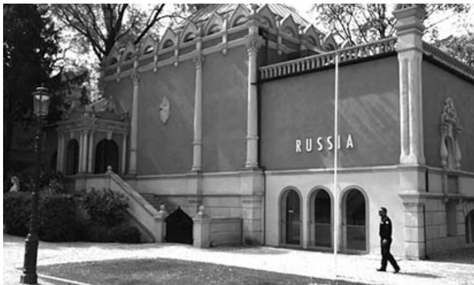
Закритий російський павільйон у 2022 році.

Це рішення не просто формальність, а болючий розрив із багаторічною традицією. Зазвичай фінський павільйон (знаменита споруда Алвара Аалто) відкриває міністр культури. У 2026 році міністр науки і культури Марі-Лена Талвітіє залишиться в Гельсінкі. Фінляндію представлятимуть лише державні службовці середньої ланки та самі митці. Таким чином країна прагне підтримати